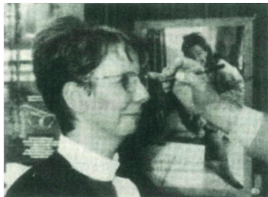
Das Resultat sah dann auf den Folien so aus:

Jahren wurde noch die „Filzstift-Strichmethode“ angewendet, bei der mit zugekniffenem Auge (!) mit einem Filzstift auf Folien Striche gemacht wurden: