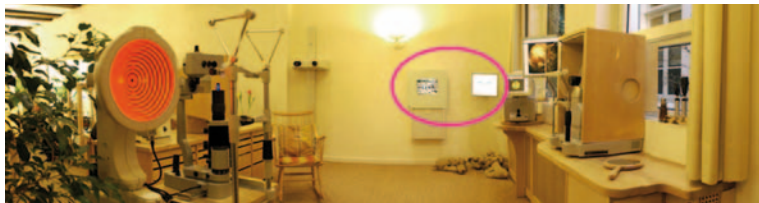
Die Darstellungen von „Kreuz.exe“ werden im Raum für Augenglasbestimmungen an dieser Stelle gleichzeitig mit den Testbildern des Binokular-Sehens dargeboten.

(leer-aktuell Oktober), 5. Erfahrung (www.DasSehen.de) → Aktuelles). In der obersten Zeile der ersten Grafik sind die (schwach) unterschiedlichen Brillenglas-Stärken zu sehen; die beiden unten rechts abgebildeten Blickrichtungen („oben“ und „unten beim Lesen“) verdienen besondere Beachtung: Die angegebenen Werte variieren fast um „3 Prismendioptrien“ (Mitte unten: 1,4 unten ; rechts unten: 1,46 oben ) – das führt beim ungeübten Benutzer einer solchen Brille sofort zu Doppelbildern! (Und wer sich nicht mit den physikalischen Ursachen auskennt, ist naturgemäß geneigt, „Gleitsicht“ die Schuld zu geben) DESHALB gilt: Wer sicherstellen möchte, dass „Gleitsicht funktioniert“, muss a. die unvermeidlichen Nebenwirkungen berechnen , b. den Kunden vorher erleben lassen , wie es