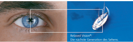
Relaxed Vision® Die nächste Generation des Sehens.