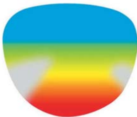
Gleitsicht für 40-jährige.

Antwort: Durch Brille-Tragen entsteht KEINE ABHÄNGIGKEIT . Wenn Sie allerdings erleben, wieviel Freude es macht, die Welt wieder richtig schön deutlich und mit viel weniger Mühe und Anstrengung