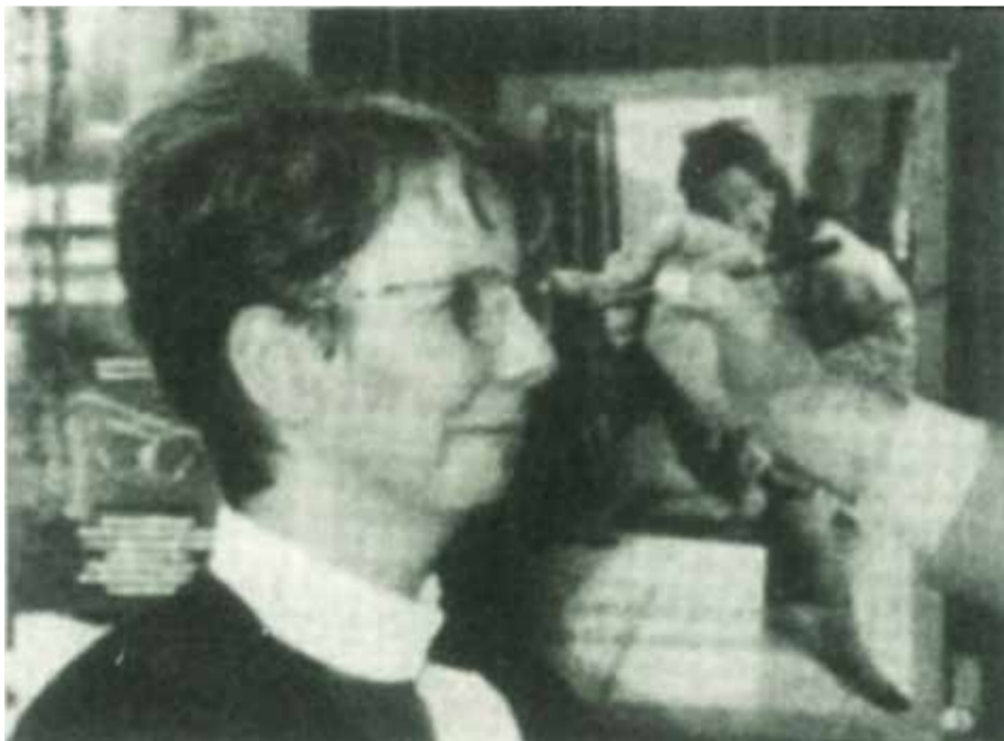
Das Resultat sah dann auf den Folien so aus:

Jahren wurde noch die „Filzstift-Strichmethode“ angewendet, bei der mit zugekniffenem Auge (!) mit einem Filzstift auf Folien Striche gemacht wurden: